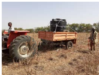
Riego de los arbolitos