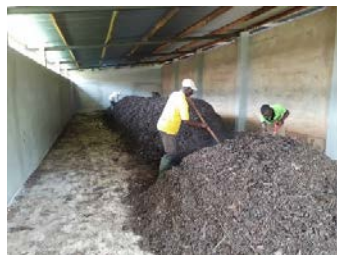
Elaboración de compost