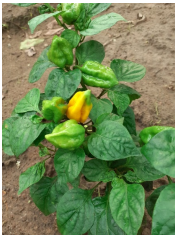
Planta de balancong

Este año y gracias a la ayuda recibida de la ONG EDIFICANDO, aparte del reto de plantación de 1000 árboles al año, han puesto en marcha una campaña de sensibilización regalando un arbolito a cada niño que nazca en el centro de salud de Tami.